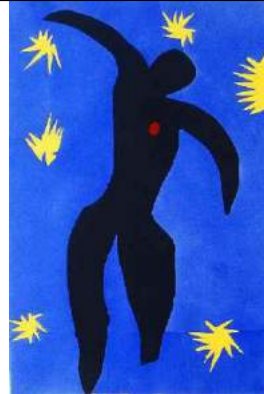
Henri Matisse, ICARO (1947)